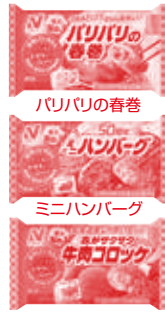
衣がサクサク牛肉コロック